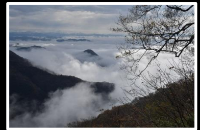
春を待つ雲海 撮影地 京都府 大江山