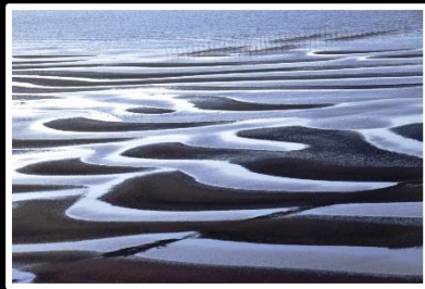
白く光る海 撮影地 熊本県 御輿来海岸