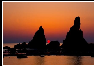
黎明の刻 撮影地 串本 橋杭岩