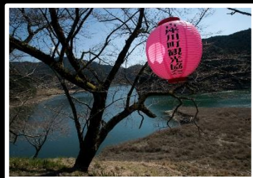
宴の前 撮影地 和歌山