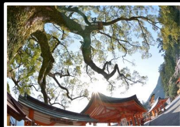
朝光燦然 撮影地 和歌山 那智