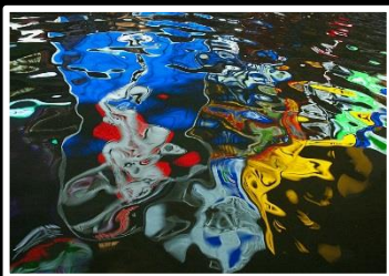
グリコも変身 撮影地 大阪 道頓堀