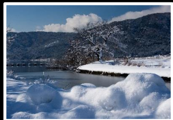
残雪残光 撮影地 滋賀 余呉湖