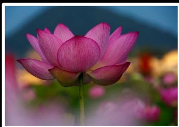
蓮乱舞 撮影地 奈良 藤原京