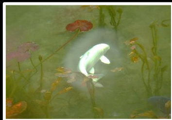
碧水に泳ぐ 撮影地 岐阜 根道神社