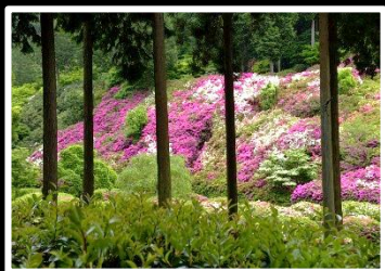
隙間見の刻 撮影地 京都宇治