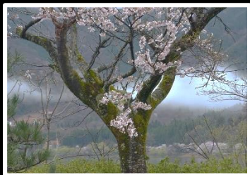
古木夢想 撮影地 滋賀県 海津大崎