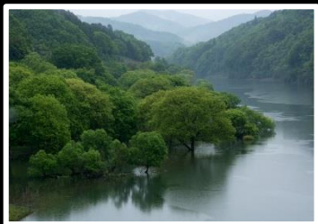
新緑に煙る山峡 撮影地 京都