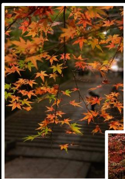
紅葉坂情景 撮影地 京都