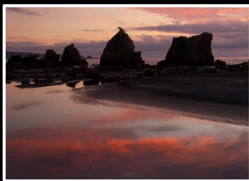
代表 宮崎 壽一郎