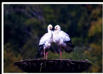
番(つがい) 撮影地 兵庫県 豊岡市