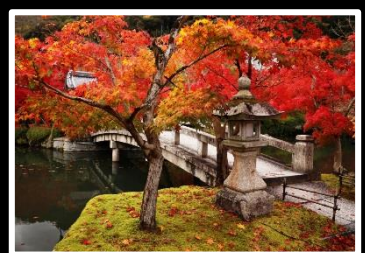
古都 撮影地 京都 永観堂