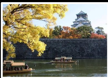
錦秋の壕巡り 撮影地 大阪城公園