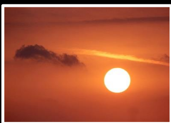
一筋の光 撮影地 大阪市