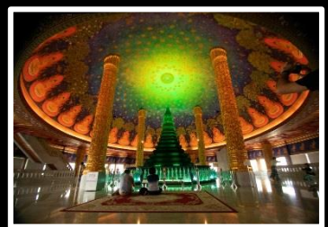
冥想 曼荼羅 撮影地 タイ・バンコク