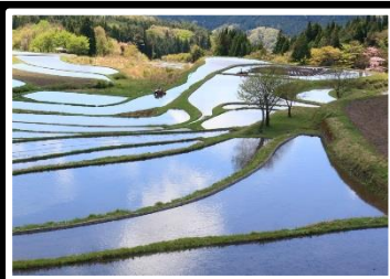
田植え準備完了 撮影地 兵庫県 養父市