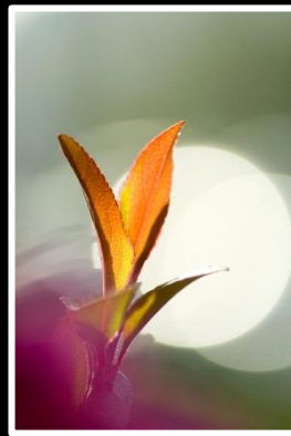
幸せの予感 撮影地 奈良 興福寺