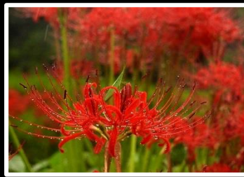
恵みの雨 撮影地 明日香