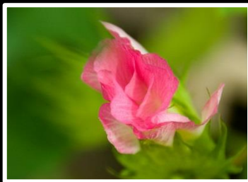
精霊の微笑み 撮影地 奈良市