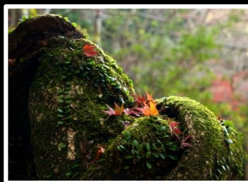
行きすぎる秋 撮影地 奈良市