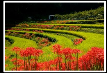
マンジュシャゲの咲く赤い里 撮影地 明日香