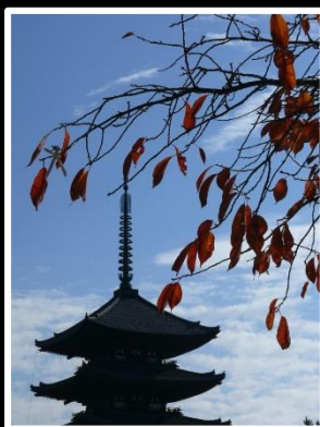
幸せの予感 撮影地 奈良 興福寺