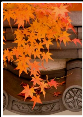
古寺といろは紅葉 撮影地 南禅寺