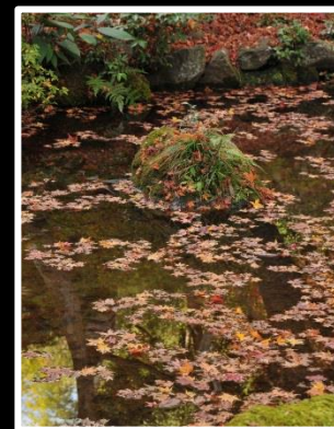
秋彩小紋 撮影地 京都 常光寺