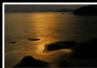
暮れ行く干潟 撮影地 新舞子