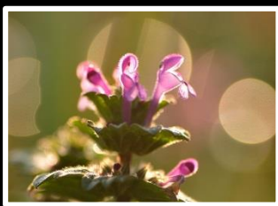
スポットライト 撮影地 奈良市