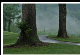
万緑を包む朝霧 撮影地 妙高市