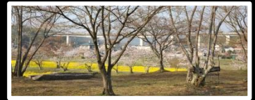
香 嵐 撮影地 観音寺