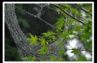
カモフラージュ 撮影地 岩船寺