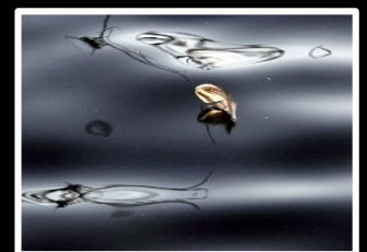
迷 鳥 撮影地 水上池