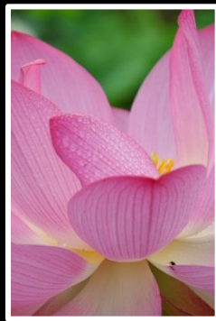
慈愛 撮影地 喜光寺