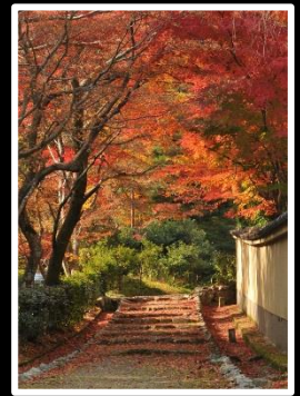
秋日和の小径 撮影地 嵯峨野