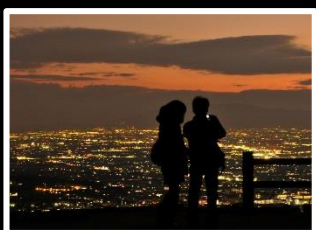
恋のシャッターチャンス 撮影地 若草山