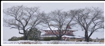
春を待つ故宮 撮影地 平城京蹟