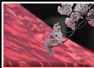
さくら、さくら 撮影地 郡山城