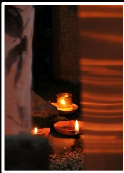
幻 碑 撮影地 元興寺