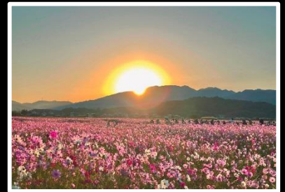
日輪輝く花園 撮影地 奈良県 橿原市