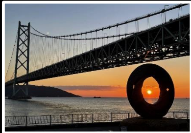
円空から未来へ 撮影地 神戸市垂水区