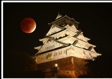
赤い月 撮影地 大阪市 中央区