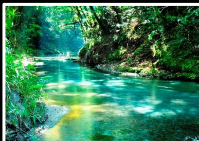
森と湧水と木漏れ日と 撮影地 鹿児島県 霧島市