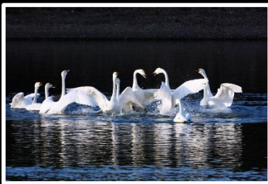
朝の挨拶 撮影地 兵庫県 小野市