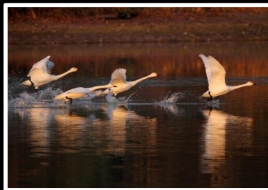
飛び立ち 撮影地 兵庫県 小野市