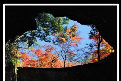
洞穴から覗き見 撮影地 鹿児島県 伊佐市