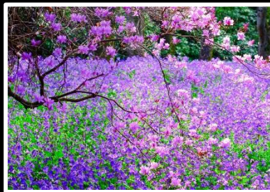
春はすぐそこまで