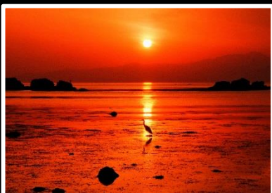
朝日を浴びて 撮影地 富山県 高岡市