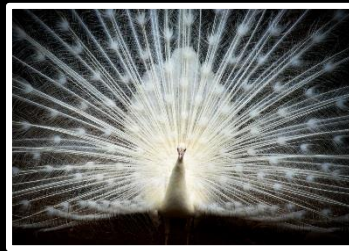
純白のドレス 撮影地 神戸王子動物園