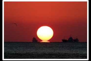
夕刻の美 撮影地 舞子公園