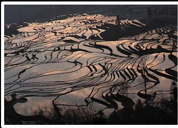
元陽の朝 多衣樹棚の棚田 撮影地 中国 元陽