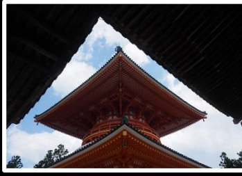
空と屋根の三角 撮影地 高野山金剛峰寺