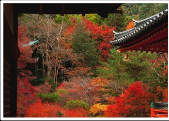
錦秋の縁どり 撮影地 京都毘沙門堂