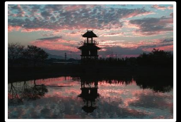
夕景の鏡 撮影地 唐古鍵遺跡