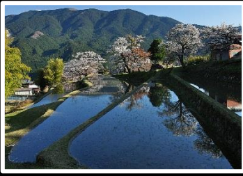
のどかな時間 撮影地 名張 三多気