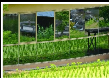
夏を装う 撮影地 けいはんな公園