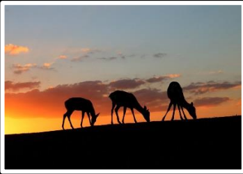
暮色 若草山 撮影地 奈良 若草山