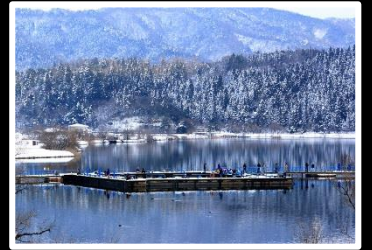
冬の風物詩 撮影地 余呉湖