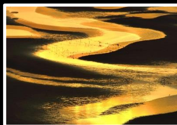
イリュージョン 撮影地 新舞子