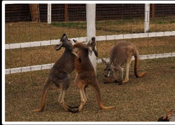
勝負の行方は 撮影地 神戸動物王国