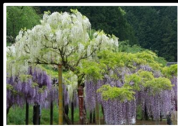
満開の藤の花 撮影地 朝来市白井大町