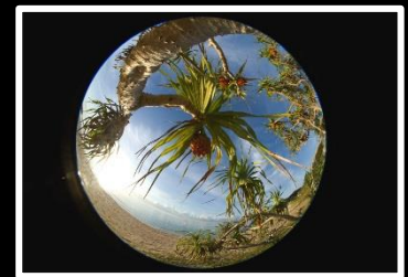
小さな宇宙観 撮影地 奄美市笠利町