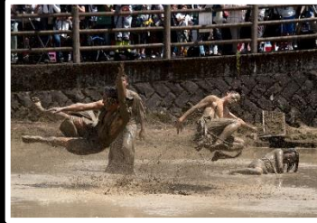
ぶっかかりあい 撮影地 愛媛宇和町