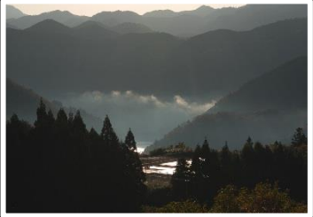
山里の目覚め 撮影地 宇陀市