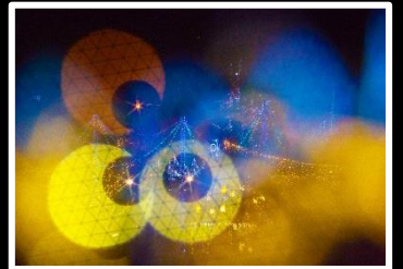
ドリームサークル 撮影地 枚方パーク