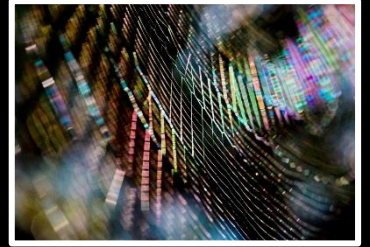
極彩色の世界 撮影地 奈良平城京跡