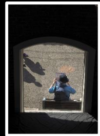
額の向こうの世界です