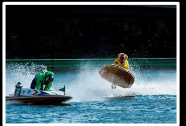
競艇の舞 撮影地 尼崎競艇場