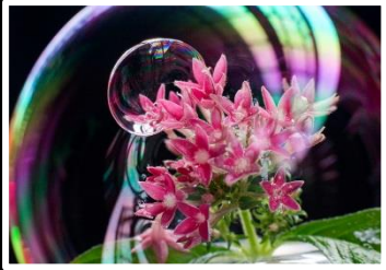
虹色のベールをまとう 撮影地 桜井市