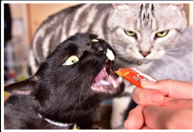
私はどうなるの 撮影地 兵庫県 神戸市