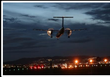
幻想の翼 撮影地 大阪 伊丹空港