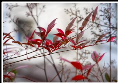
ちいさな葉たち 撮影地 兵庫県 長田神社