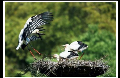
子育て大変 撮影地 兵庫県 豊岡市