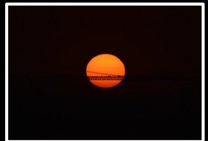
一点必撮 撮影地 兵庫県 垂水海岸