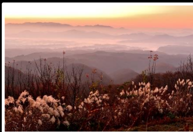
夜明けの色調 撮影地 岡山県 真庭市