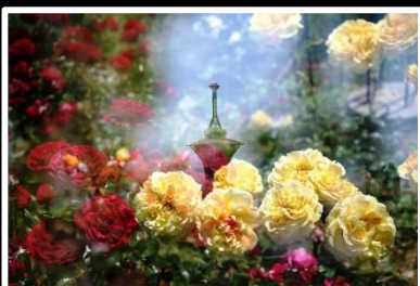
塔と薔薇のコラボ！