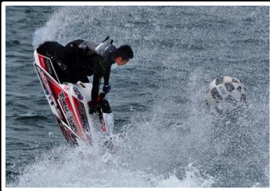
凄いテクニック 撮影地 和歌山県