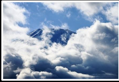
ベールをぬいだ富士山 撮影地 山中湖