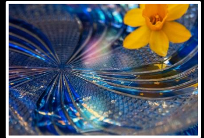
銀河へ誘う 撮影地 奈良市