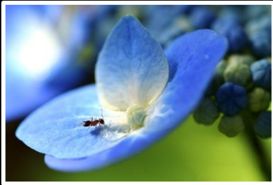
四葩(よひろ)の玉露 撮影地 奈良市