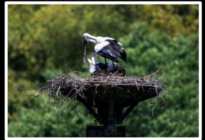
大空に夢が咲く 撮影地 兵庫県 淡路島