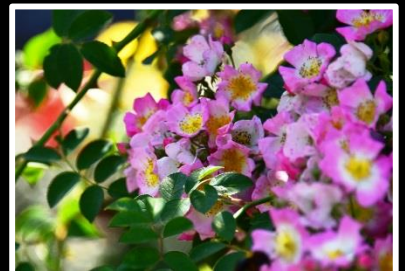
華 撮影地 兵庫県 神戸市 (★=遺作)