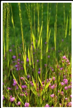
撮影地 京都府 木津川市