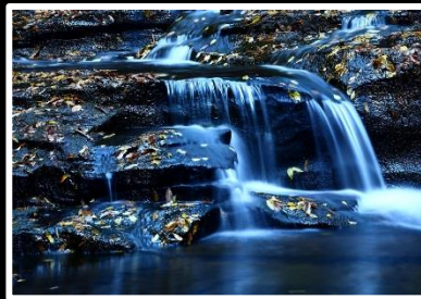
白色溪流 撮影地 三重県 赤目四十八滝