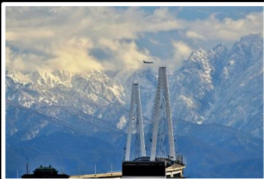
天空の共演！ 撮影地 富山県 射水市