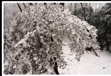
霧氷の造形エビの尻尾 撮影地 奈良県 高見山